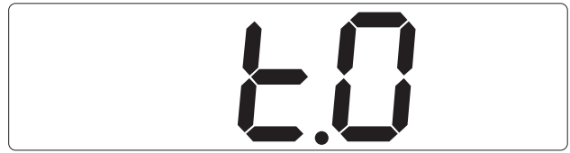
٤٠ (-5KHz 120 CH)

Ejemplo de pantalla cuando se enciende el equipo configurado [٤٥] (fig.1). Después de 2 segundos (fig.2). Exemple d'afficheur à l'allumage du poste configuré [٤٥] (fig.1). Après 2 secondes (fig.2). Example of the display at power on, setted [٤٥] (fig.1). After 2 seconds (fig.2).