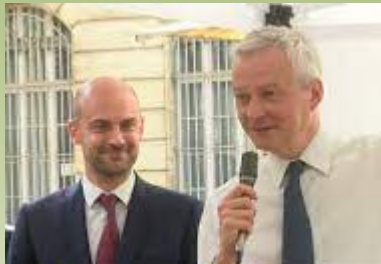
J.-N. Barrot et B. Le Maire Ministre délégué chargé de la Transition Numérique et des Télécommunications, Ministre de l'Economie, des Finances et de la Souveraineté Industrielle et Numérique